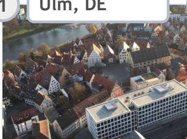
1 Ulm, DE