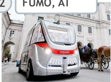
2 FUMO, AT