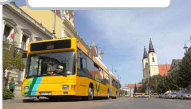
3 Zalaegerszeg, HU