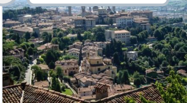
5 Bergamo, IT