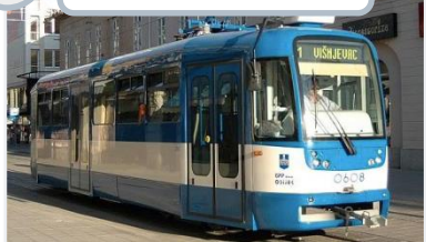
4 Osijek, HR